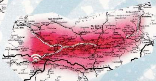
SENDEGEBIET ANTENNE 2