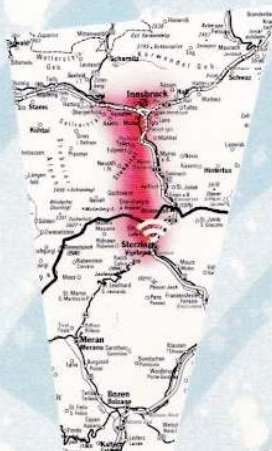
SENDEGEBIET ANTENNE 3