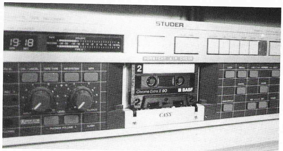
„Vorsicht Air Check“: Mit diesem Kassetten-Tapedeck wird alles mitgeschnitten, solange das Mikrofon des Moderators auf Sendung ist.

Dieses Mantelprogramm wird auch zum Verkauf angeboten. Das heißt, jede Radiostation hat die Möglichkeit, dieses Mantel-