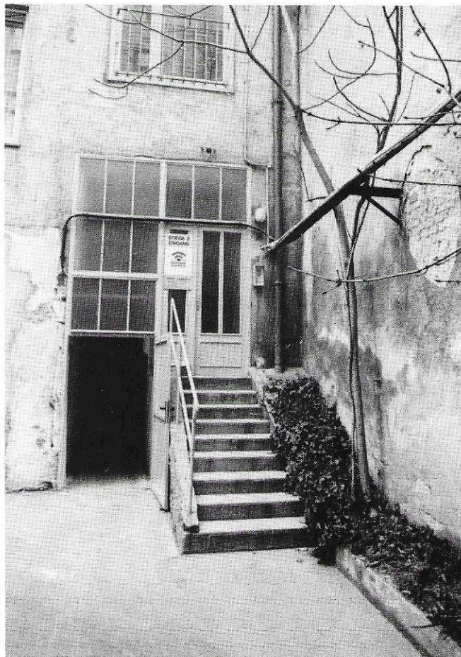
Hinter dieser idyllischen Hinterhof-Fassade verbirgt sich der erste österreichische Privatsender.

ist ein technisches Medium. Und da sollte man sich halt auch auskennen, was unter den Schieberegeln passiert.“ — Bei Ö3 war Klock achteinhalb Jahre. Ob ihm das Fernsehen abgeht? – "Die Arbeit im Fernsehen war für mich bewußtseinsweiternd und hat auch viel Spaß gemacht. Aber Radio liegt mir mehr. Ich kann mit dem akustischen mehr anfangen als mit dem optischen.“ Und: „Radio ist das intelligentere Medium. Es braucht die Phantasie des Zuhörers. Außerdem ist es wesentlich mobiler. Man kann Radio überall consu-