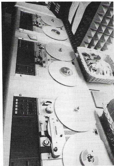
Vom Feinsten: Studer-Tonbandmaschinen, beispielsweise für das Abspielen von Werbespots oder Reportage-Beiträgen.

Klock: „Es wird bei uns nicht vorkommen, daß wir beispielsweise zwei Hardrock-Platten hintereinander spielen. Es muß eine ständig sich ändernde Musikfarbe geben.